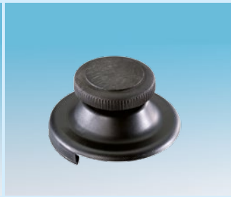
Lüfterschraube für Flachfitting