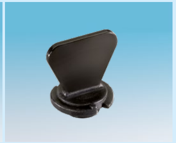
Lüfterschraube für Korbfitting

Zapf-Spaß mit Party-KEGs von SCHÄFER: Einfach anstechen, zapfen und frisches Fassbier genießen.