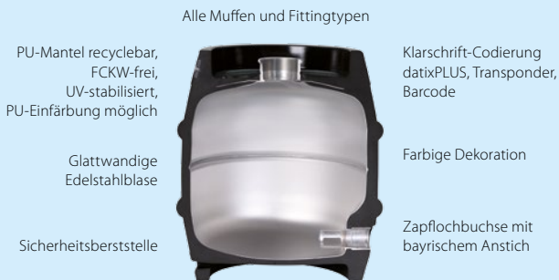
Alle Muffen und Fittingtypen

Dank Federvertil verschließt sich das KEG automatisch, wenn der Zapfhahn entfernt wird. Das garantiert ein tropfsicheres Handling und den optimalen Schutz des Bieres.